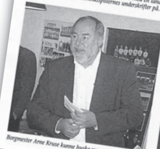
Borgmester Arne Kruse kunne huske mange år tilbage.