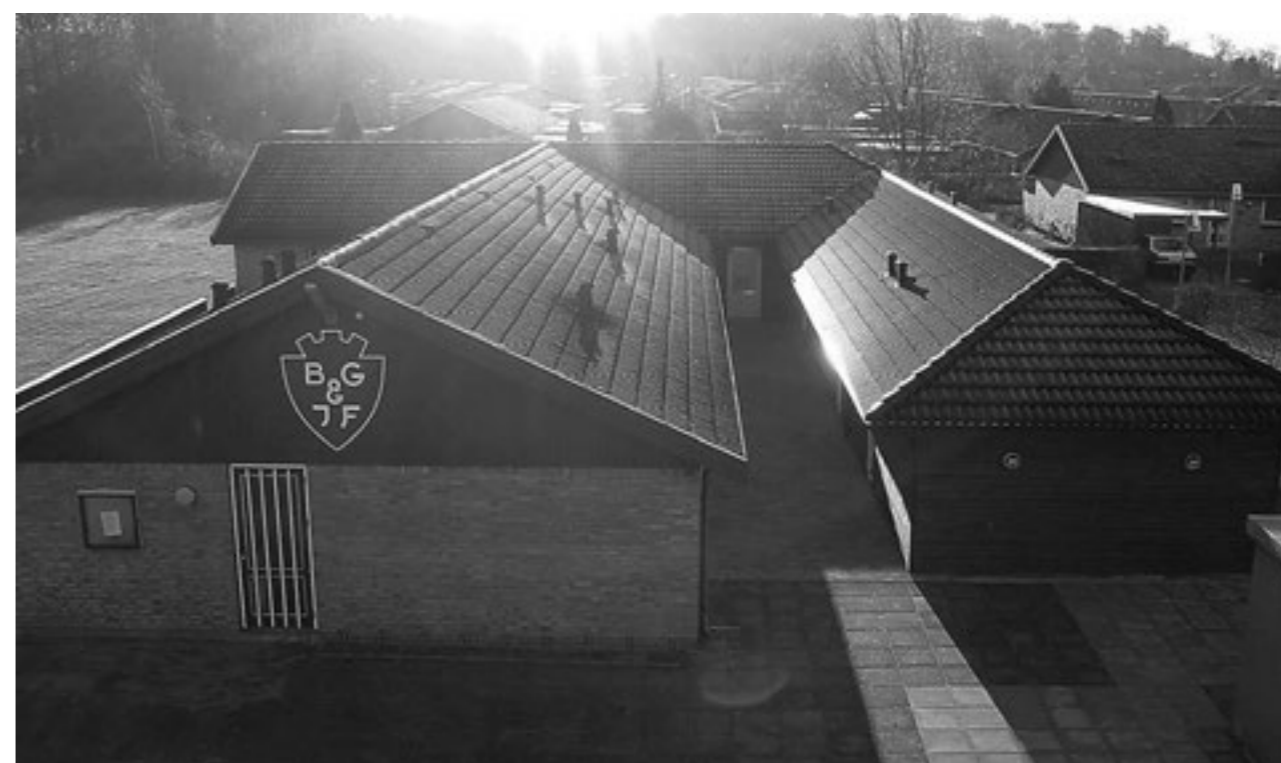
Østre Idrætsanlæg, 2004.