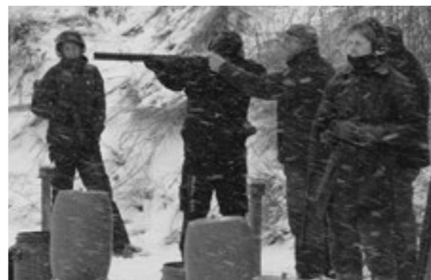
Lerdueskydning på Als.