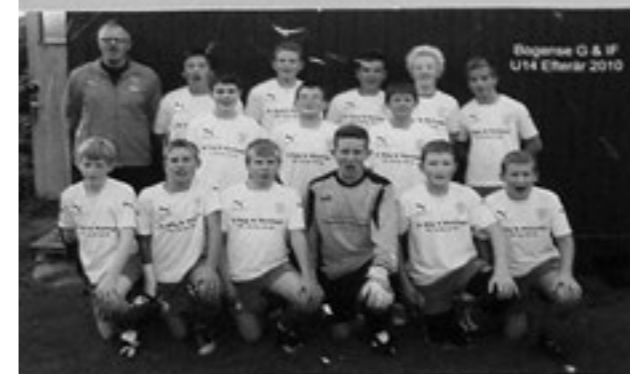
Bogense G & IF U14 Eliteser 2010