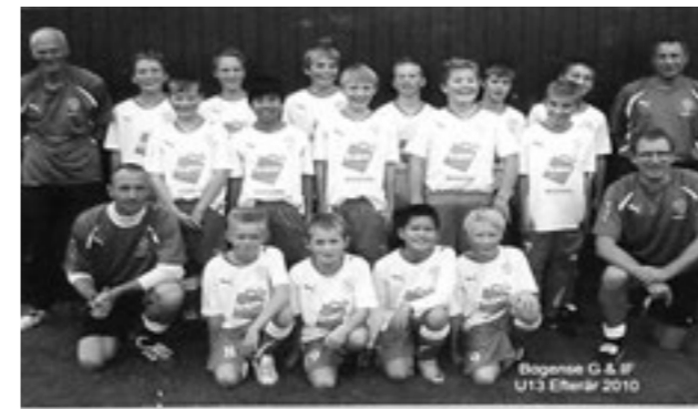
Bogense G & IF U13 Eliteser 2010