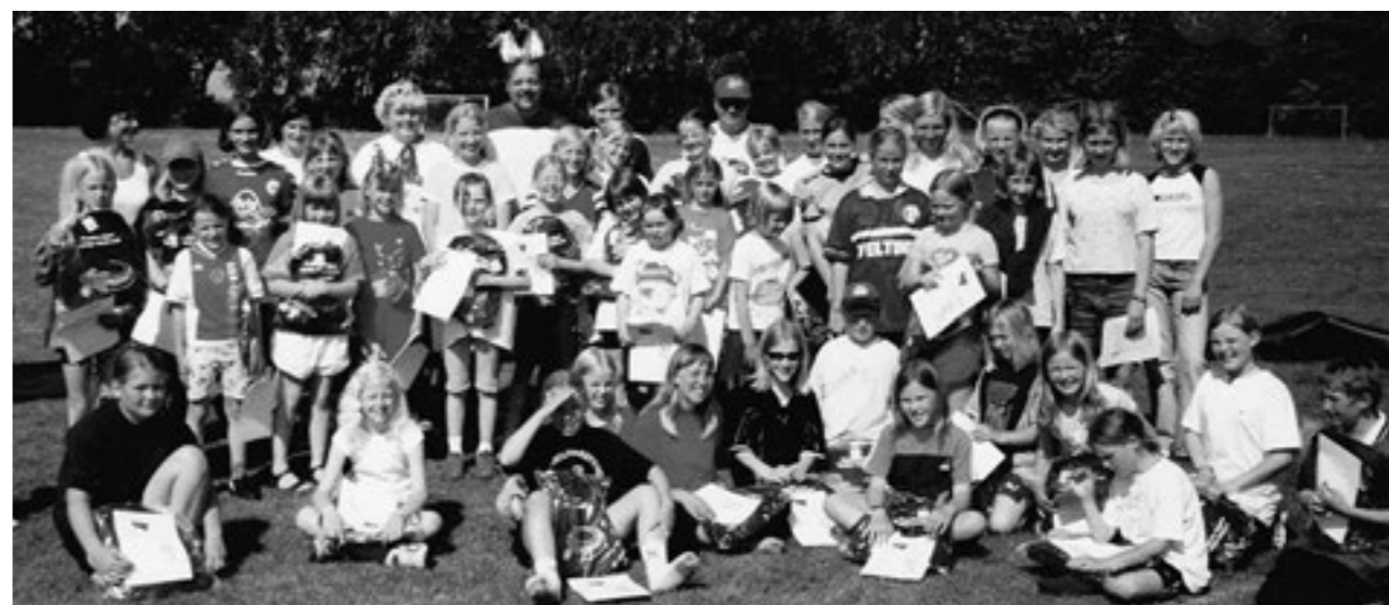
Deltagere fra Pigeraketten fra et tidligere år.