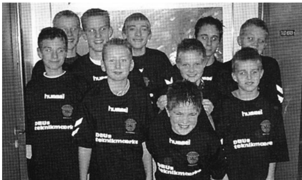
Stolte drenge iført deres flotte trøjer, som tegn på at de har modtaget DBU's tekniskmærke.