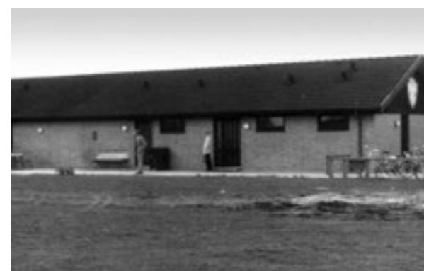
Østre Idrætsanlæg, 1978.