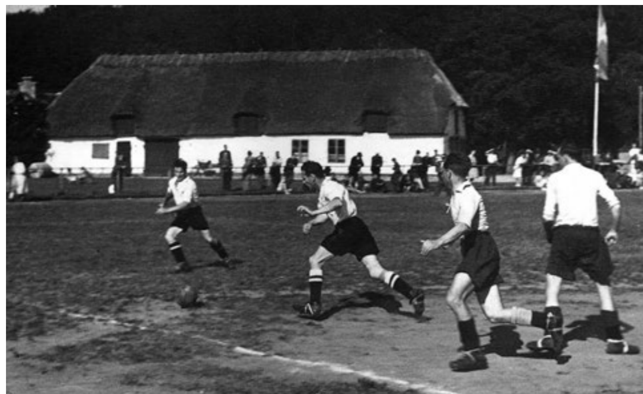
Den gamle lade, Fredskoven, 1937.