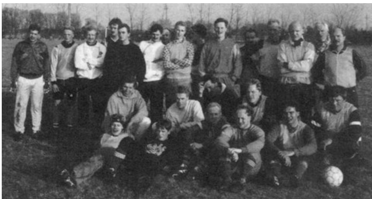
Seniorene er klar til at starte sæsonen 1991.