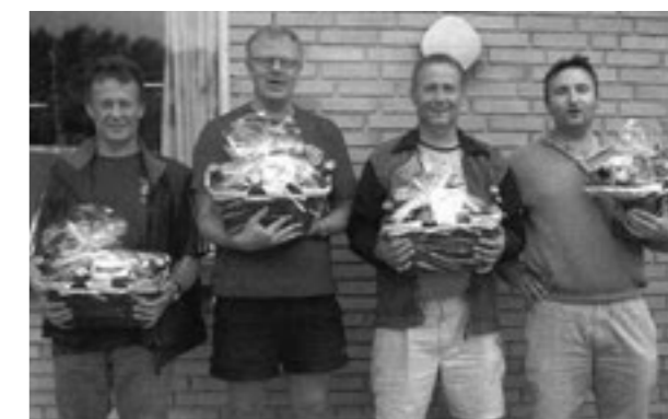
Trænere og holdledere i seniorafdelingen foråret 2009.