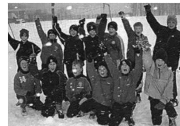
Lilleputerne gik i gang tidligt på året.

Så dette er, hvordan et fodboldår forløber i BG&IF i 2014 – nok en del anderledes end for 100 år siden, men en ting er sikkert, nemlig at bolden stadig er rund og skal ind i rusen.