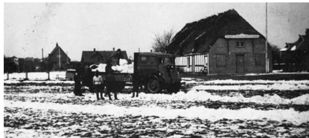
Fodboldbanen ved Skovriddergården ryddes for sne før kamp (ca. 1950).