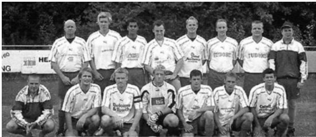
Herre serie 2.