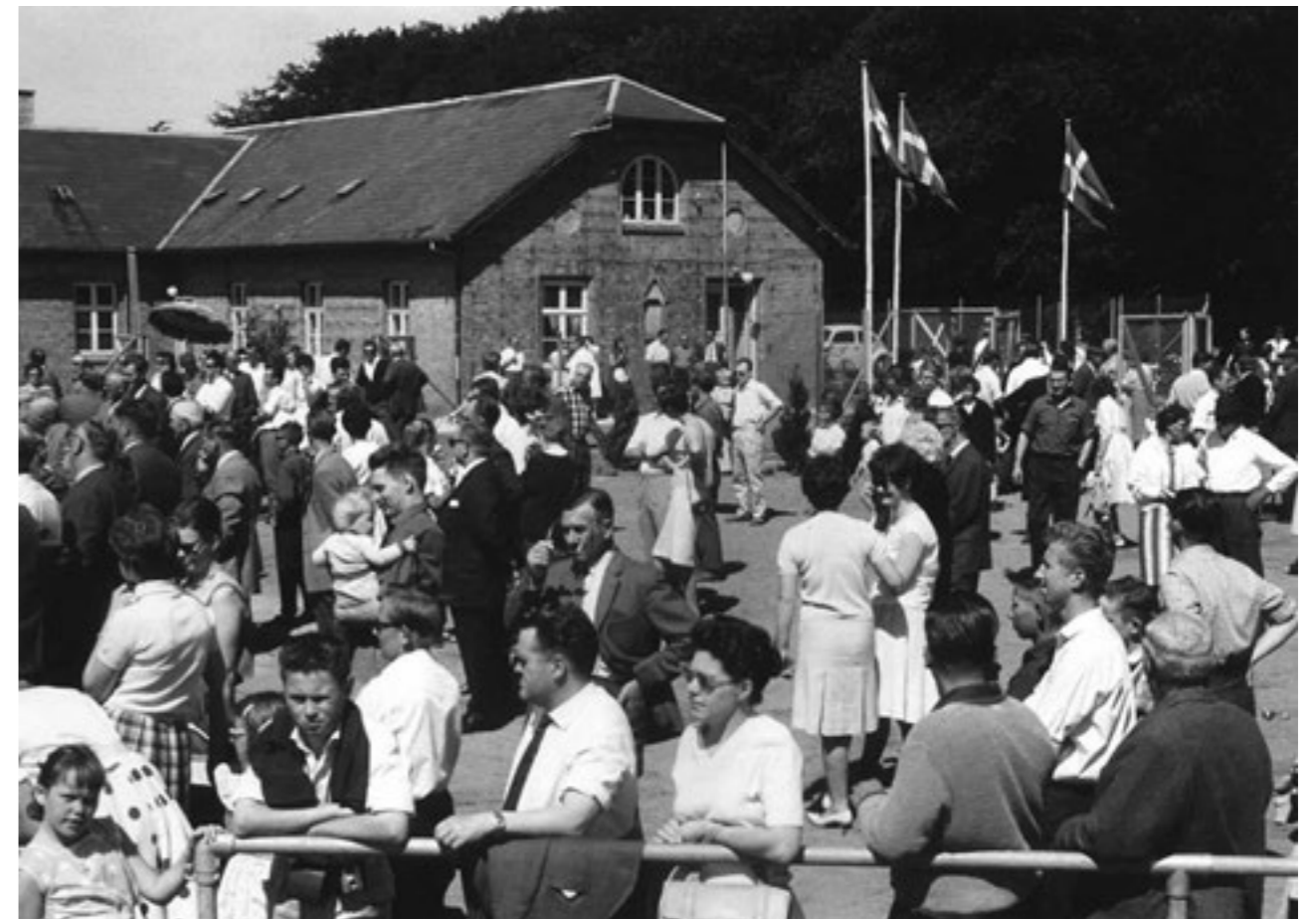
Stadionindvielsen ved Skovriddergården, 1962.