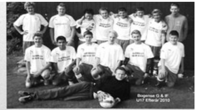
Bogense G & IF U17 Eliteser 2010