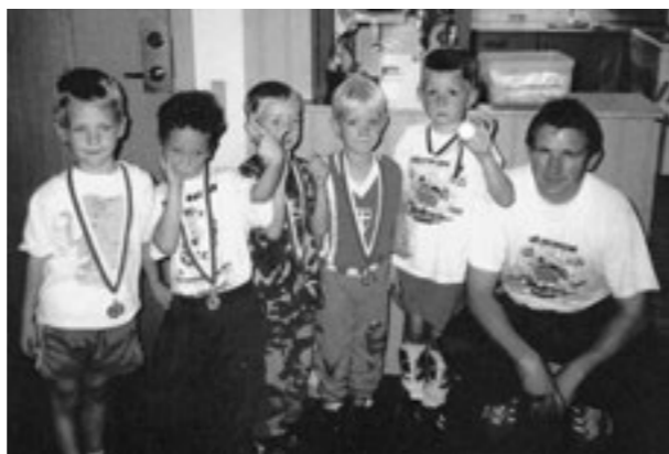
Palle ligeledes med nogle af de mindste.

Lasse startede med at træne ungdomshold fra omkring 1981 og har derfra ind imellem trænet de unge, sidst fra 2005-2008. Lasse blev "Årets Leder" i klubben i 1982 og har været holdleder igennem rigtig mange år