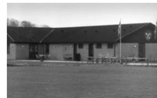
Østre Idrætsanlæg, 1983.