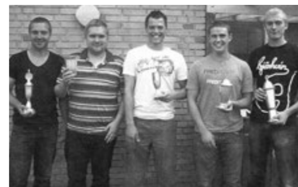
Årets spillere 2008/09.