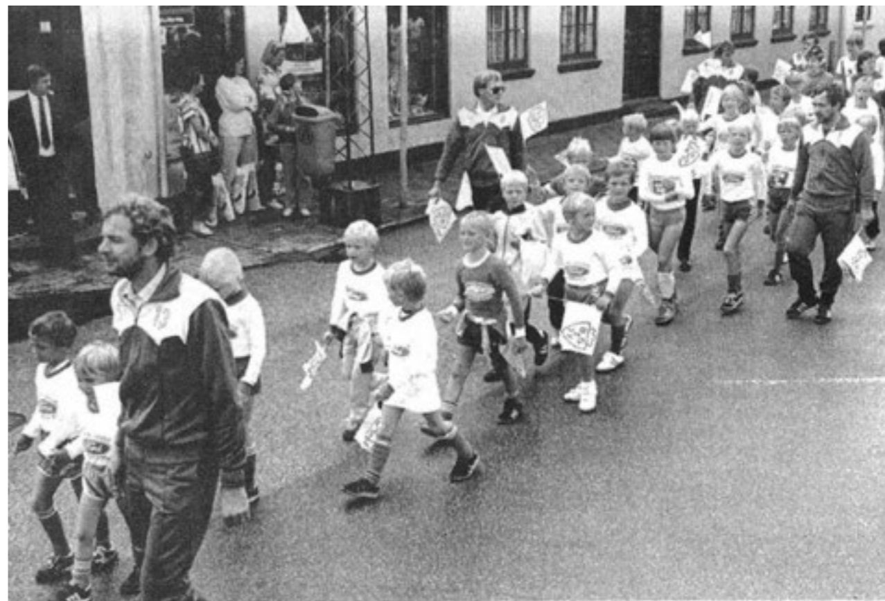
Glade BG&IF-drenge fotograferet ved optøget til præriefesten 1985.