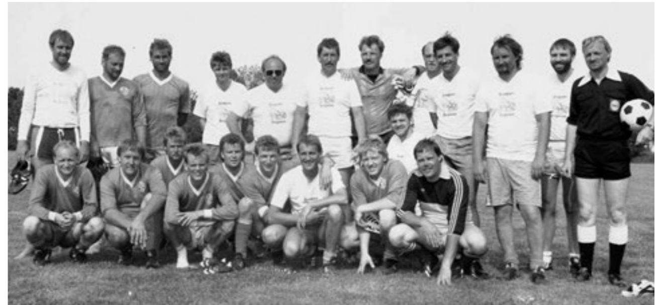
1989. Gamle Bogense-spillere hjemme til kamp - årgang 1954/55 mod blandet Bogense-hold.