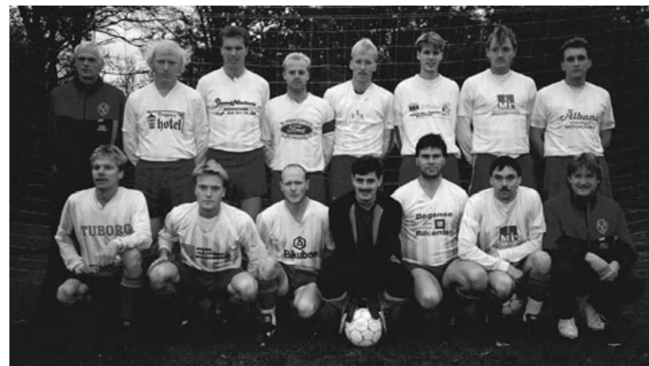
1991. Fynsmester i serie 3.