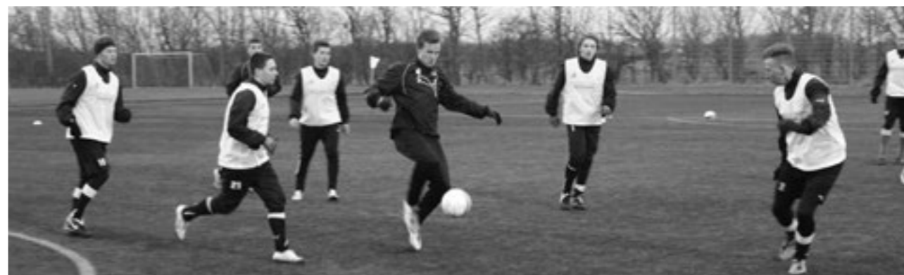
Træningspas på Skærbæk kunststofbane.