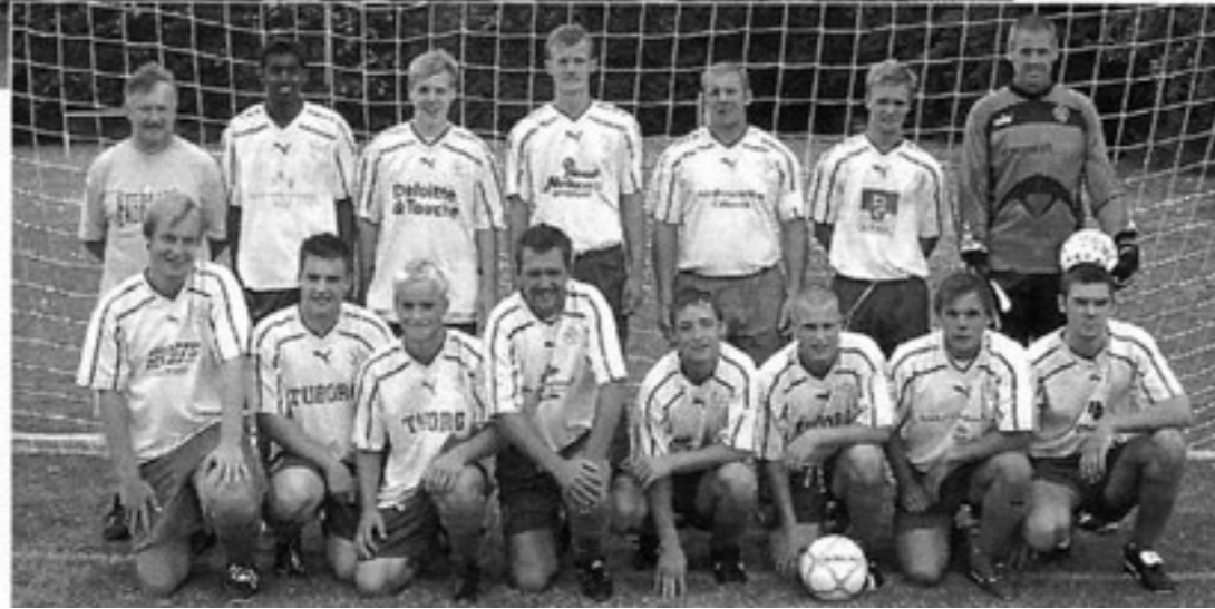
Herre serie 4.