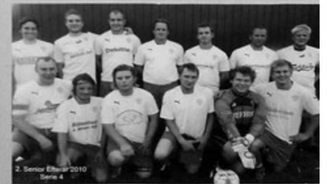
2. Senior Eliteser 2010 Serie 4