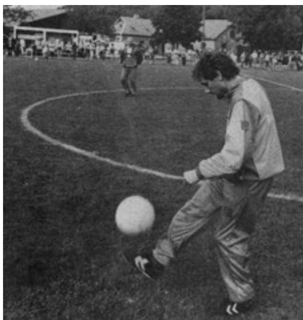
1988. Den lille storspiller fra Vejle, Allan Simonsen, varmer op på Bogense Stadion.