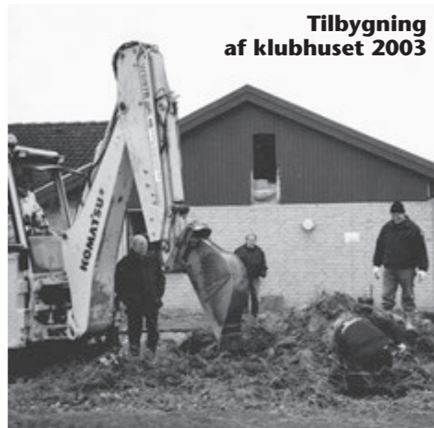
Tilbygning af klubhuset 2003