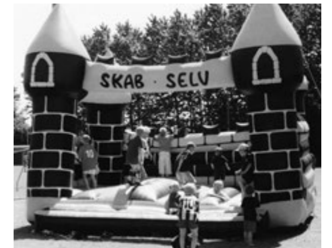
Hoppeborgen var et hit blandt de små under klubdagen.

Her ved indgangen til jubilæumsåret - deltager BG med 10 ungdomshold for drenge og 3 for piger.