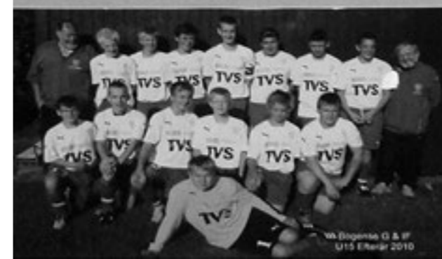
10. Bogense G & IF U15 Eliteser 2010