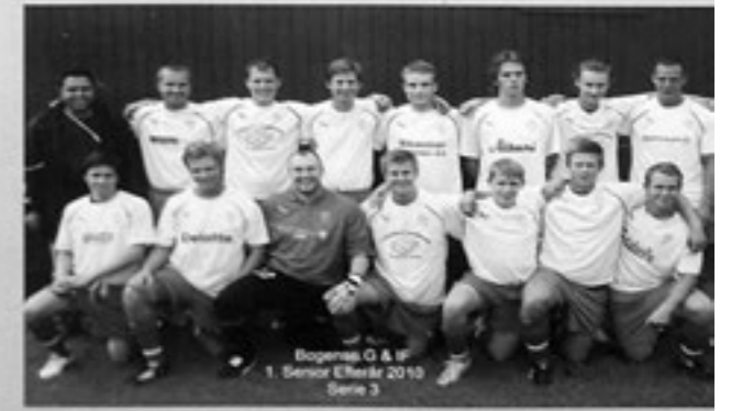
Bogense G & IF 1. Senior Eliteser 2010 Serie 3