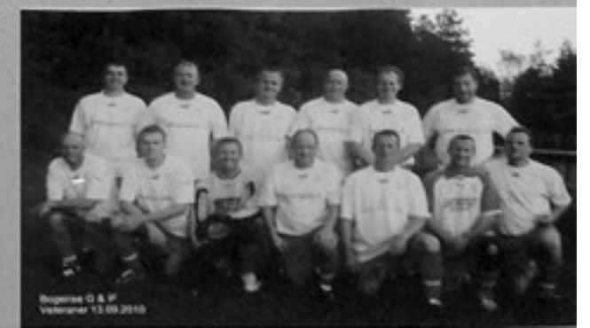
Bogense G & IF Veteraner 13.09.2010