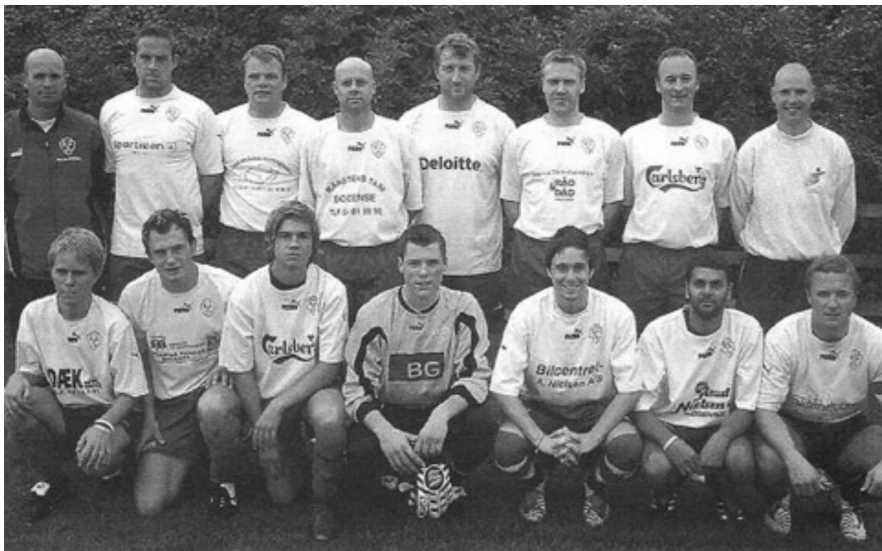
2005. Herre serie 2.